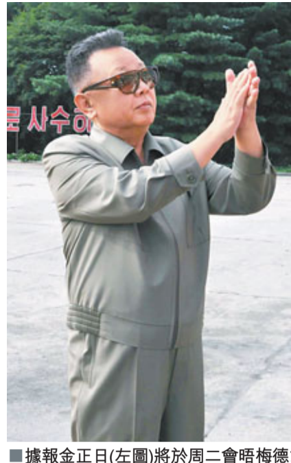
據報金正日(左圖)將於周二會晤梅德韋傑夫(右圖)。