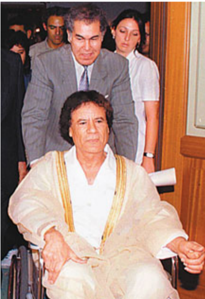
賈盧德曾是卡扎菲親信，圖為他於1998年7月為卡扎菲推輪椅。路透社

在醫院聚集捐血支援。 路透社/美聯社/法新社/《衛報》/《每日電訊報》/《紐約時報》/美國有線新聞網絡