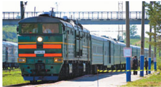
據稱是金正日乘坐的專列抵達哈桑。

俄國明年將舉行亞太經合組織首腦會談，迫切需維持東北亞和朝鮮半島地區穩定，故俄國可能通過朝俄首腦會談，敦促朝方為解決核問題作出讓步。金正日接班人金正恩會否隨行仍無法核實，但韓聯社說，鑑於金正日早前訪華時，並沒帶同金正