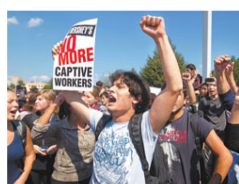
大批交流生在工廠外抗議，神情激動。

約200名來自世界各地的交流生，上週在美國賓夕法尼亞州集體示威，抗議美國第二大朱古力廠好時壓榨及克扣工資，令交流生入不敷支，無法體驗美國文化。有關公司前日提出補償方案，安排交流生參觀美國景點，但遭對方拒絕。