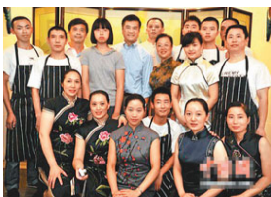
駱家輝與喻家廚房全體人員合影。中新網