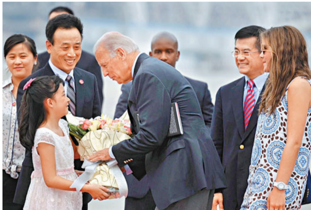
20日下午，美國副總統拜登乘坐專機抵成都。圖為成都小朋友向其獻花。

18日中午，訪華的美國副總統拜登忙裡偷閒，在美新任駐華大使駱家輝的陪同下，於中午時分帶著孫女來到北京鼓樓附近一家小吃店品嚐北京小吃。由於小店只有7張桌，人滿為患，駱家輝的妻子莫納及拜登的孫女在拜登到來前，提前幾小時來到店內「佔座」。