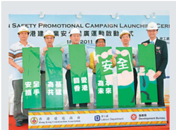
香港建造商會昨日起,聯同發展局及勞工處舉辦為期一周的「香港建造業安全推廣運動」,重點宣傳有關工地吊運、高空工作及酷熱天氣下工作的安全考慮。

聯想香港在場內推售3,999元起的平板電腦IdeaPad Tablet K1,倘若在會場內購買,可獲額外價值1,000元的保護套及課程禮品。而購買IdeaPad U260,會場價可減2,000元,以4,999元發售。參展商Sony Computer Entertainment在會場內設立遊戲區,搶先讓市民試玩射擊、賽車等明年初才推售的遊戲。