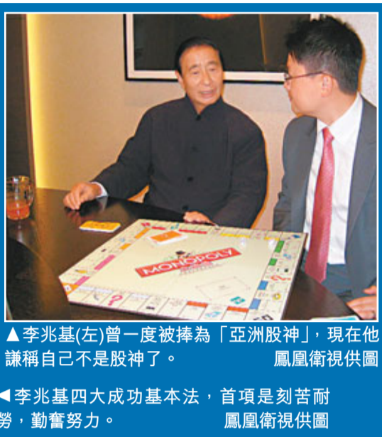
▲李兆基(左)曾一度被捧為「亞洲股神」,現在他謙稱自己不是股神了。鳳凰衛視供圖 ▲李兆基四大成功基本法,首項是刻苦耐勞,勤奮努力。鳳凰衛視供圖