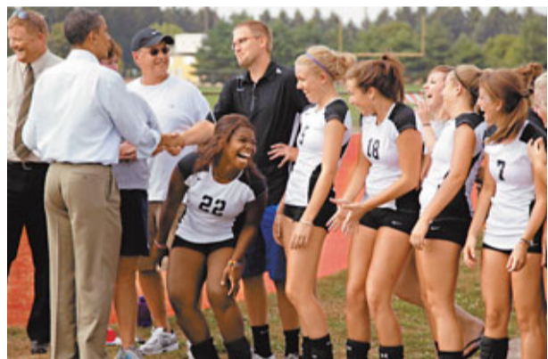
■奧巴馬進行中西部之旅期間，接見一間學校的女子排球隊。

美國經濟疲不能興，政府負債疊疊，失業率居高不下，令總統奧巴馬爭取連任阻力大增，最新民調顯示，認同奧巴馬處理經濟問題的受訪者創下26%新低。據報奧巴馬下月初將推出新刺激經濟方案，促進就業並減赤逾1.5萬億美元(約11.7萬億港元)，試圖藉此挽救民望及回應共和黨抨擊。