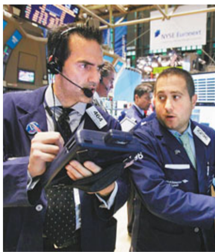
■歐美股市再度大跌，交易員(小圖)密切注視市況，圖為紐約交易所。