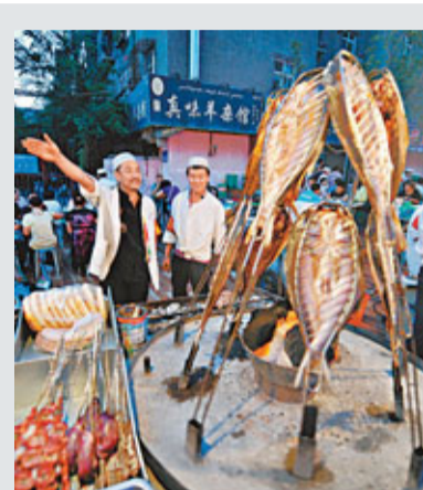
新疆美食多樣,廣受歡迎。圖為烏魯木齊夜市燒烤。資料圖片