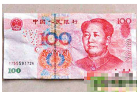
「TJ55」字頭的人幣假鈔。

國外匯管理部門聯合公安機關開展打擊跨境資金違規流動專項行動,共破獲地下錢莊和網絡炒匯案件10起,涉案金額累計超過100億元人民幣,對遏制跨境資金違規流動、震懾「熱錢」流入發揮重要作用。