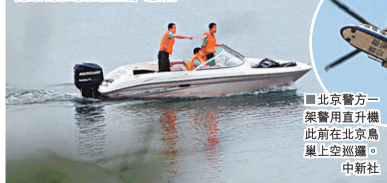
北京警方一架警用直升機此前在北京鳥巢上空巡邏。

香港文匯報訊 北京警方一架警用直升機17日上午在結束搜救訓練返航途中,墜落北京東北郊外的密雲水庫。截至記者發稿,搜救仍在進行中,5名機組人員已救上1人。記者下午3時左右趕到密雲水庫時,通往墜機庫區的道路已被警方封鎖,事發水域靠近水庫西岸,岸上較高處修建有負責防衛的軍事營區,營區內停着數輛急救車及救援、消防車輛,有戰士穿着救生衣,列隊往返於營房與西岸的簡易碼頭之間。在事發庫