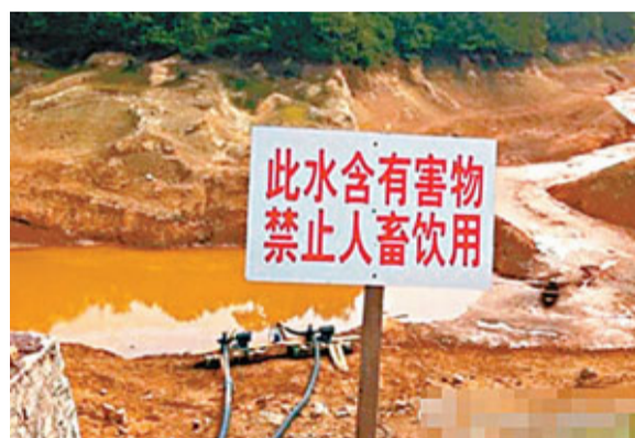
傾倒劇毒銻渣現場寸草不生,邊上豎起了警示牌。

2011年上半年,外匯管理部門與公安機關密切配合,在廣東、福建、深圳等省市開展系列打擊跨境資金違規流動專項行動。行動共搗毀16個非法交易窩點,抓獲外匯犯罪嫌疑人員37名,收繳現鈔折合530萬元人民幣,凍結銀行卡及銀行存摺等賬戶200餘個,凍結資金折合1300萬元人民幣,另扣押汽車、電腦等一批作案工具。