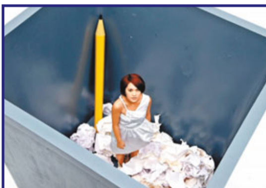
楊丞琳爬進廢紙堆中，表現出失望的感覺。

香港文匯報訊 (實習記者 陳麗芸) 楊丞琳新專輯《仰望》持續大賣，一舉拿下港台六大銷售榜冠軍寶座，唱片公司大手筆地送出一顆行星，並以她的英文名命名為「RAINIE STAR」，令楊丞琳非常驚喜，直呼是這輩子以來收到最好的禮物。