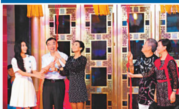
趙本山「劉老根」會館開業暨《鄉村愛情5》開機儀式在北京劉老根大舞台隆重舉行。章子怡、成龍、張柏芝、宋祖英、徐克、楊受成、小沈陽等明星齊亮相捧場，為新會館開業錦上添花。張柏芝更是乘坐趙本山私人飛機由象山到北京。