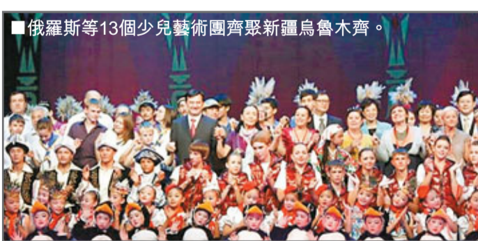
俄羅斯等13個少兒藝術團齊聚新疆烏魯木齊。

香港文匯報訊 (記者 賀臻 烏魯木齊報導) 來自俄羅斯聯邦、哈薩克斯坦、吉爾吉斯、塔吉克斯坦的6個少兒藝術代表團，與來自新疆天山南北的7個少兒藝術代表團齊聚「歌舞之鄉」—新疆，不同國家背景的孩子同台舞蹈。