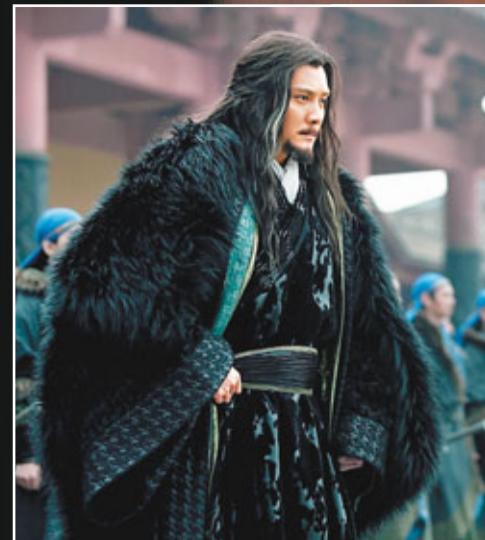
馮紹峰飾演的項羽眼神堅定，讓人眼前一亮。