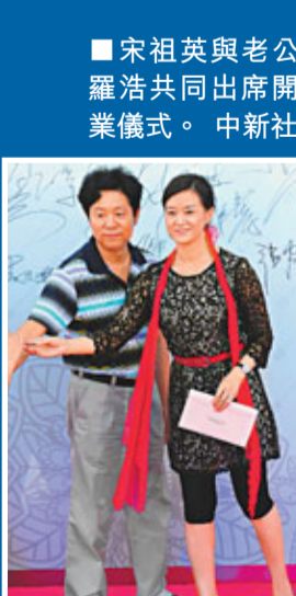
宋祖英與老公羅浩共同出席開業儀式。