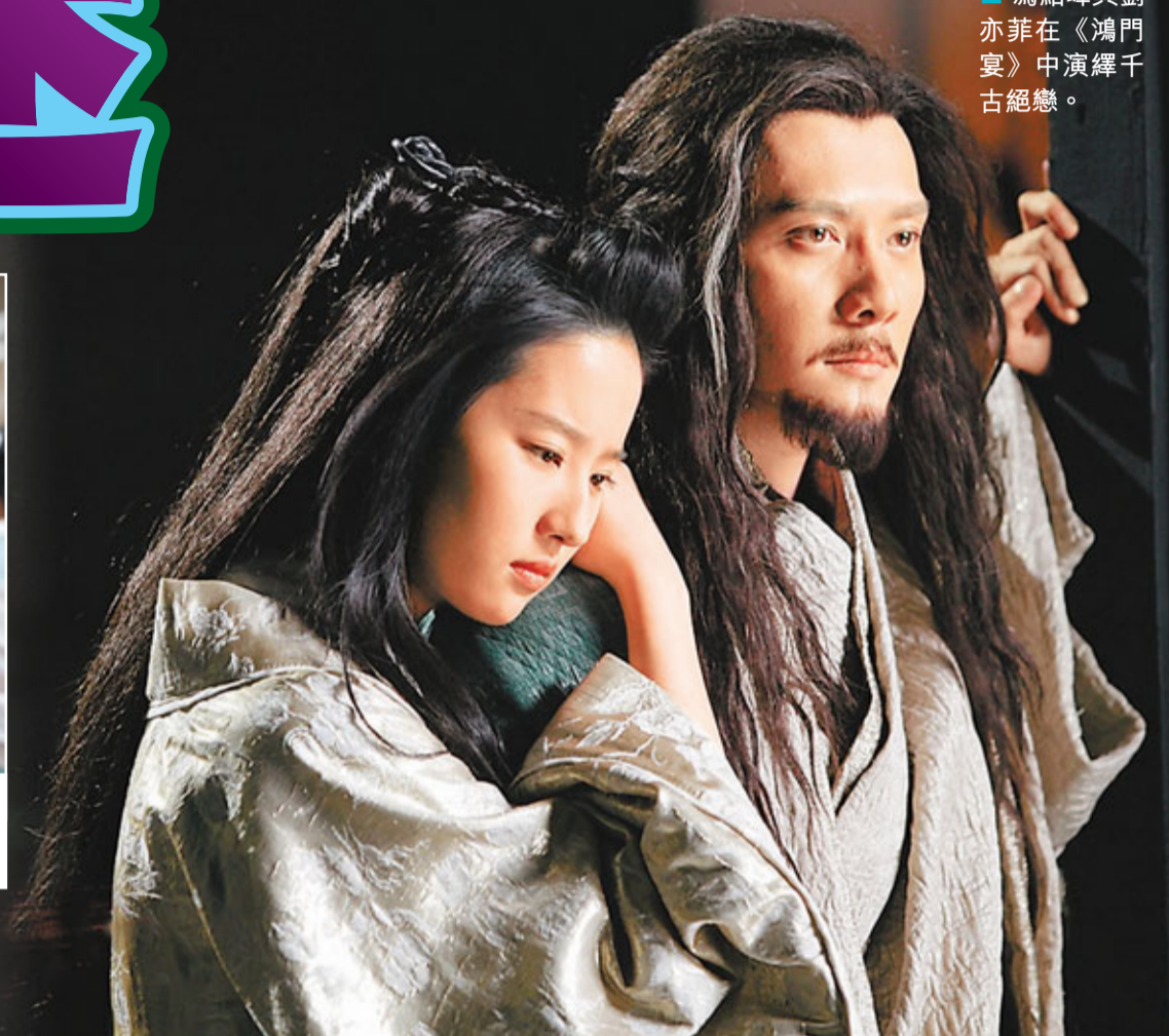
馮紹峰與劉亦菲在《鴻門宴》中演繹千古絕戀。