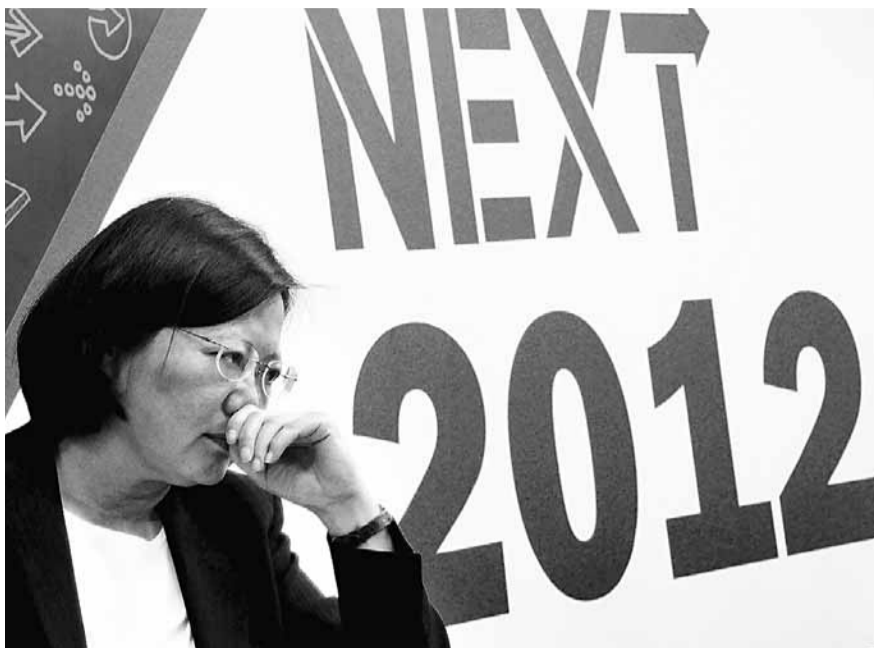
台媒認為，島內獨派將世代交替的希望寄托在蔡英文身上，其獨性也許比李登輝、陳水扁更甚。一旦她上台，台灣在國際角色上的下一步恐更嚴峻。中央社

如今蔡英文獲得獨派簇擁。她不再以「四不一沒有」作為暫時的掩護，更不會再提「國家統一」，甚至直接主張兩岸「相互承認主權」。比李、扁都更露骨地高舉「台獨」旗幟。於此形勢下，一旦她勝選執政，兩岸關係只會比陳水扁時期更差，三年來的和平發展必告逆轉。