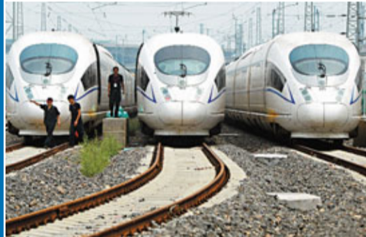
■上海開始整修召回的CRH380BL型動車組。