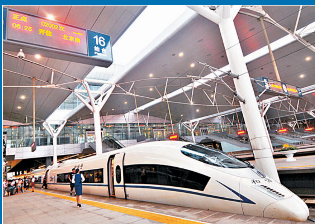
■16日,首列降速的京津城際C2002次動車組列車準備開出天津站。

張德江指出,「7·23」甬溫線特別重大高鐵路交通事故再一次警示我們,必須堅持把安全作為發展高鐵路的首要前提和根本保證,全面加強高鐵路安全工作,切實把速度、質量、效益與安全統一起來,實現高鐵路安全運營以及鐵路事業健康發展。開展安全大檢查,是促進高鐵路及鐵路事業科學發展、安全發展、可持續發展的必然要求,是提升政府公信力、公眾滿意度的迫切需要,是促進安全生產形勢持續穩定好轉的重要舉措。