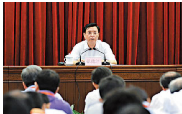
■國務院召開高鐵路及其在建項目安全大檢查動員部署會議。

此次降速調圖是中國鐵路2011年以來的第二次降速。7月初,京滬高鐵路、滬寧城際高鐵路已分別將最高時速從380公里、350公里降低到300公里。關於此次列車開行方案調整,鐵道部副部長胡亞東介紹,共涉及到動車組列車約428.5對,其中直通125對、管内303.5對。而所有速度調整的動車組列車,票價均下浮5%左右。