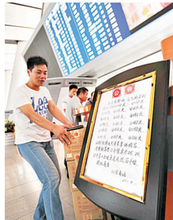
■16日,北京南站內擺放着關於京滬高鐵路停運列車情況的公告牌。

他強調,高鐵路降下來了,但管理不僅不能降低標準,相反還要升級才能確保高路路的健康運行。「管理不是要降,是要升。對安全管理機制、安全管理規章制度等方面全面進行檢查,對安全管理各環節進行計劃,能夠保證在不同情況下安全管理制度到位,應該做得更好。」