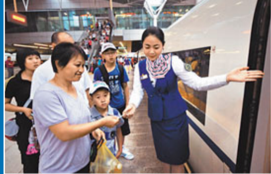
■在天津站,京津城際列車乘務人員為乘車旅客提供引導服務。