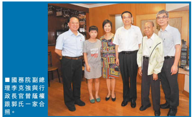
國務院副總理李克強與行政長官曾蔭權跟郭氏一家合照。