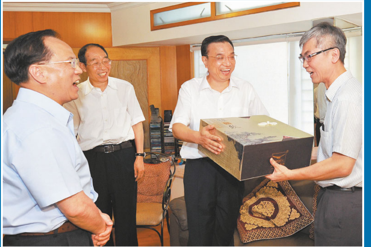
李克強副總理贈送一套茶具給戶主郭桂明留念。

國家「十二五」規劃將港澳發展獨立成章，李克強今日會宣布有關香港與內地經貿合作的好消息。在探訪郭家期間，他亦向郭桂明一家談及國家的「十二五」規劃，將對香港的中產帶來很大的幫助。