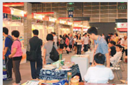
■寧波優質農產品頗受香港市民喜歡。

香港文匯報訊(記者 茅建興、白林森,特約記者 康莊嚴 報道)為期3天的2011寧波(香港)優質農產品及名茶展13日閉幕。這是寧波連續第三年到香港舉辦展銷會和推介活動,本次展會集展示、推介、商貿洽談和招商引資於一體,藉香港美食博覽平台,達到了樹形象、打品牌、拓市場的預期目的,擴大了寧波農產品的影響力。