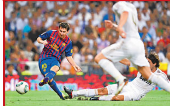
美斯(左)射入一球。

昨晨西班牙超級盃首回合，皇家馬德里在主场只能逼和未有強陣出擊的巴塞羅那2:2，周三次回合作客失去優勢。