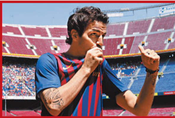
法比加斯親吻巴塞隊徽。

法比加斯在2003年10月對洛達咸的聯賽盃賽事中首次代表阿仙奴上陣，以16歲177天之齡成了歷來為阿仙奴一線隊披甲最年輕的球員。同年12月，他在大勝狼隊5:1的賽事中，亦成為了阿仙奴最年輕的入球者。過去5個英超球季，他為阿仙奴創造了466個入球機會。2008年，法比加斯當選了英格蘭足球員協會的年度最佳小將。法比加斯只曾隨阿仙奴在2004年贏得英超冠軍以及在05年足總盃封王，然而在西班牙國家隊，他卻隨隊勇奪2008歐國盃以及2010世界盃錦標，其中在南非世盃決賽，就是他傳給恩尼斯達攻入奠勝一球。