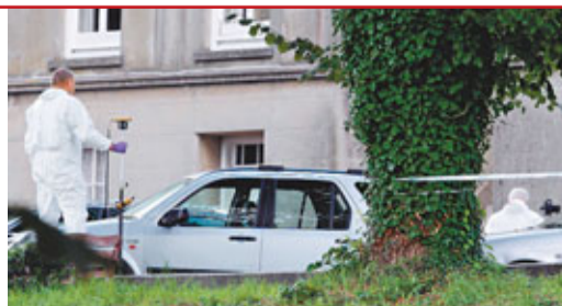
聽到1名女子高呼「救命」，隨即跑到現場了解情況。

警方前日下午3時接報在主要城市里赫利爾發生斬人案，醫護車隊隨即趕至。有鄰居看到2名女童的屍體被抬離現場，另一遇害女子滿身鮮血，場面非常恐怖。該鄰居稱，有醫護人員忍不住落淚，其中1人衣服沾滿血要即場更衣。有人