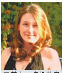
其中一名搶劫者為富豪千金。

他們緣何成為《聖經》裡的夏娃？ 英國暴亂的成因是甚麼？從政策層面看，也許是政府的緊縮政策不得人心；從社會學角度看，也許是貧富懸殊、種族矛盾帶來的社會分化。但從心理學上看，或許是8月的炎夏似火，一群躁動的年輕人，潛意識裡的貪婪、惡暴被點燃，人人紅了眼睛放火、搶掠，迷醉的眼睛直把一座大城市當成一個原始森林…… 騷亂中的暴徒以年輕人為主，不少人一直奉公守法，自己也未料想到竟然會成為騷亂一分子。一個偷去一台電視機的女學生，被警方拘捕後抱頭痛哭，她的母親甚為不解：她根本不要甚麼電視機，為甚麼她要這樣做？ 答案是：她以為在那一個時刻自己是不用負責任的。事實上，自英國聯合政府上台後，公共開支銳減、大學學費猛增，多個地方已曾出現暴亂事件：保守黨總部被搗亂，王儲查爾斯座駕也被圍攻，等等。這些騷亂中，警方沒有大肆追究，年輕人以為只要人數夠多，聲勢夠大，便不用負刑責，便等於到了另一個時空，人世間的法律制約、道德規範全不適用。 當身旁的暴徒無所不為，放火搶掠的行為成一種誘惑，旁觀的人也蠢蠢欲動，甚至深怕自己「錯過」唾手可得的「戰利品」，哪怕是一瓶蒸餾水、一支潤唇膏，以及錯誤罪惡的快感。這其實是一場超規模的「抽水」行為。 直到警方終於強硬執法，參與騷亂的年輕人一一被捕，紛紛拉高衣衫遮掩面部，才全部恍如《聖經》裡的夏娃，忽然明白了自己的醜陋。騷亂從來就像一場瘟疫，但一個社會到底是因此多了抗體，還是更為一沉不起、病入膏肓？這恐怕是整個歐洲社會所要思考的嚴肅課題。 ■張啟宏