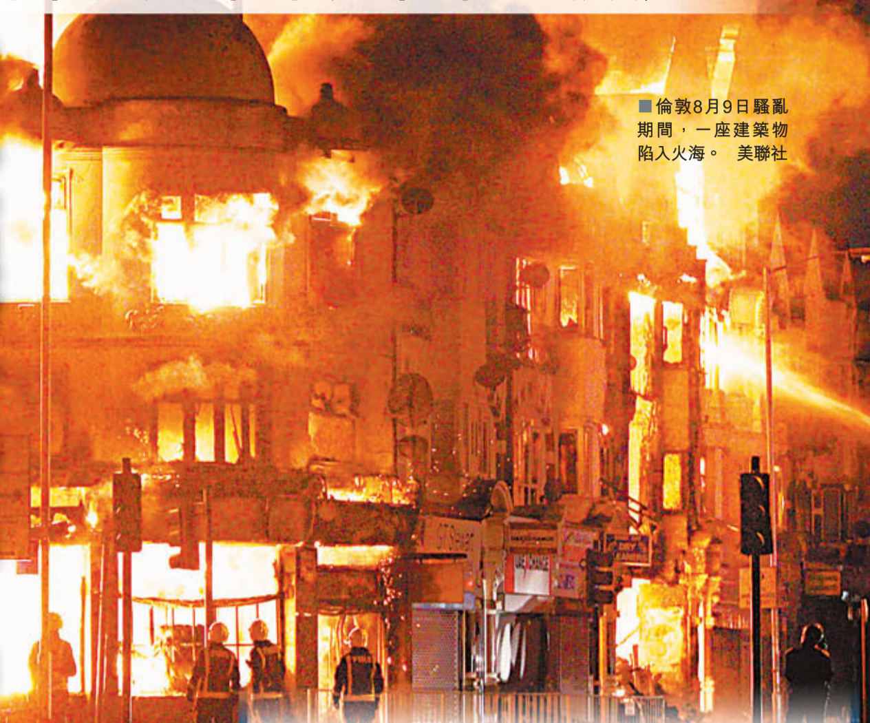
倫敦8月9日騷亂期間，一座建築物陷入火海。

英國騷亂結束，警方大舉搜捕懷疑滋事者，但社會各界探討是次騷亂的成因才剛剛開始。分析家認為，是次「8月之亂」成因極為複雜，具有深層社會經濟原因，更反映迷途青年成為影響歐洲穩定的「計時炸彈」。