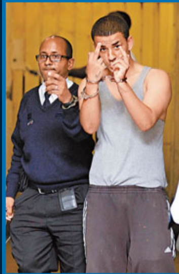
迷途青年影響歐洲穩定。圖為英國警方拘捕兩名騷亂疑犯，他們年齡不足20歲。