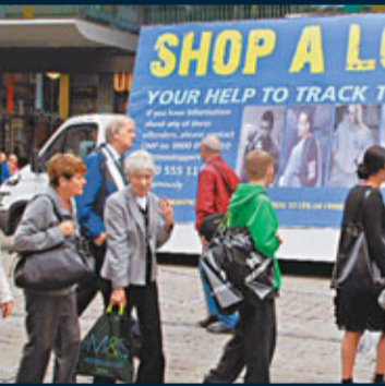
倫敦緝捕騷亂暴徒，在警車上張貼疑犯樣貌，要市民提供線索。

曾任首相卡梅倫顧問的克魯格認為，是次騷亂可以帶來兩點啟示，就是過往政府的福利政策沒有作用可言，「你不可能僅靠愛心和政府開支換來社會安寧」；當局應該採取一定的威嚇手段，「嚇得他們不敢出家门」，才能維持社會安寧。