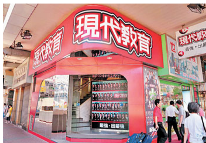
現代教育通告指，香港海關已指海外公司Noble Spirit與現代教育香港並無關連。

香港文匯報訊(記者 劉璇) 現代教育(1082)昨發通告，就禁止旗下間接全資附屬現代教育香港處置Noble Spirit的公司銀行帳戶限制令作澄清。該公司指出，現代教育香港於8月12日下午被送達限制令及其他法庭文件後，即時向香港海關及律政司投訴該事件並要求立即修正。