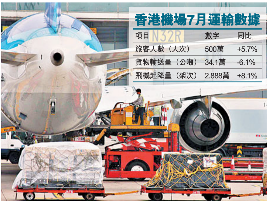
香港機場7月飛機起降量升8.1%至28,880架次，創單月新高。

特定航空公司的旅客可以在深圳市內這兩個預辦登機地點取得登機證，然後乘坐定時穿梭深港兩地的巴士或轎車前往香港國際機場搭乘國際航班。使用氹仔碼頭的旅客更可以在碼頭托運行李，令旅程更輕鬆自在。許漢忠補充道，預辦登機服務擴展至深圳及澳門更多地點，讓利用香港機場廣闊航空網絡往來世界各地的旅客，得以享用更優越、更便捷的服務。