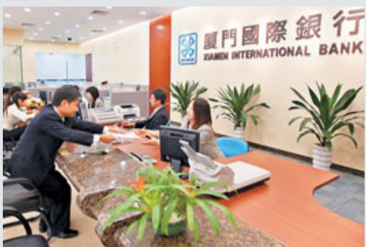
閩信集團今年曾承諾逐步減少並最終悉售度銀。

閩信現時擁有度銀36.75%權益，於緊隨出售事項完成後將減少至31.75%。出售度銀後，閩信獲利1.72億港元。