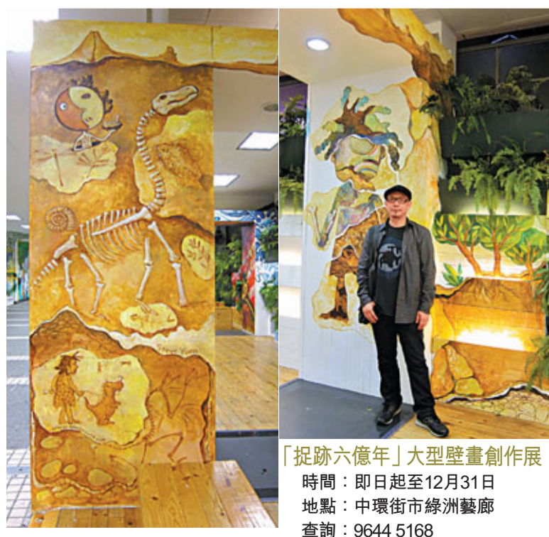
「捉跡六億年」大型壁畫創作展 時間：即日起至12月31日 地點：中環街市綠洲藝廊 查詢：9644 5168