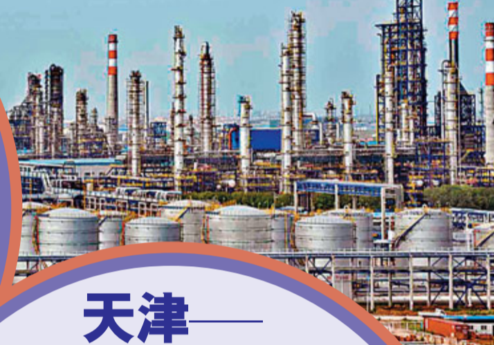
■濱海新區千萬噸煉油項目

一個地區經濟的快速發展，離不開資本的注入和企業的支持。近年來，天津市憑藉濱海這塊金字招牌，受到了大批包括跨國公司在內的海內外知名企業的青睞。據統計，「十一五」期間，天津市實際利用外資累計366億美元，是「十五」時期的2.5倍，增速連續4年居全國前列。其中，濱海新區實際利用外資251.5億美元，佔全市的68.7%。截至目前，已有147家世界500強企業在天津投資建廠，其中120多家企業的230多個項目落戶在濱海新區。同時，一大批國家級的優質項目以及內地各行業領軍企業也紛紛看好天津，搶灘濱海。「十一五」期間，濱海新區利用內資超過千億。