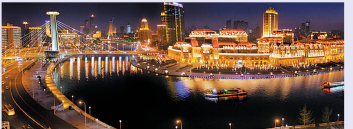
■天津津灣廣場及海河夜景

「世界其他地方不可能發生的，這裡可能發生。」英國皇家科學院院士、著名城市地理學家彼特豪爵士曾這樣讚賞濱海，讚歎天津。的確，天津和濱海新區演繹了「又好又快」的故事，創造了新世紀天津城市發展的奇蹟。