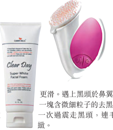
Clear Day Super White Facial Foam

經常出暗瘡，多屬於油性或混合性皮膚，所以潔面產品除了要溫和之外，還要有去角質的成分，例如LHA及BHA等，能疏通毛孔，一般來說，對於油性肌膚，泡沫裝及啫喱裝的潔面產品最為清爽。潔面以外，還需要每星期進行2至3次磨砂，及使用深層潔面的面膜，將底層的污垢排出。韓國品牌Clara Hills的美白潔面泡沫，維他命B3成分有清潔及美白的功效，而綠茶精華成分可防止皮膚過敏及令皮膚放鬆。(售價HK$78/150g)