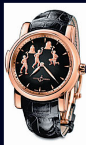
■TRIPLE JACK 三問報時腕錶