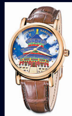
■天壇拾絲琺琅彩繪腕錶