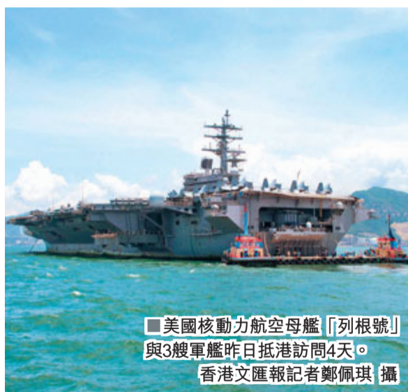
■美國核動力航空母艦「列根號」與3艘軍艦昨日抵港訪問4天。

美軍「列根號」於2003年中服役，屬於尼米茲級核子動力航空母艦。今年3月日本發生大地震及海嘯後，「列根號」曾經奉命往當地協助救災。