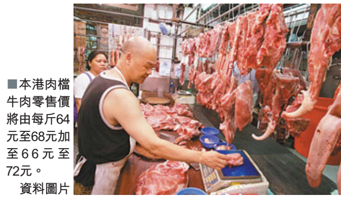
■本港肉檔牛肉零售價將由每斤64元至68元加至66元至72元。資料圖片

香港文匯報訊(記者 曾偉龍)在香港、內地通脹高企的情況下，五豐行宣布，活牛批發價即日加價3.51%至3.98%，是今年第4度加價，平均每兩個月漲價一次。肉價頻繁加價，已累積12%加幅。業界估計，活牛零售價即日加價3元，每斤鮮牛肉動輒72元才有交易。肉販表示，肉價飆升造成「趕客」情況，不少市民已轉吃冰鮮牛肉，令鮮牛肉生意較年初下降10%，導致行業萎縮。