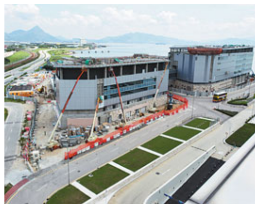
■民航處新總部將於明年第3季落成。

香港文匯報訊(記者 羅敬文)耗資近20億元的民航處新總部，將於明年第3季落成。新航空交通控制系統，將於2013年底投入服務，有能力處理每年逾80萬航班升降；即使加建第三跑道，令每年升降量增至62萬架次，可謂「綽綽有餘」。民航處處長羅崇文表示，當落實加建跑道方案，預料需要額外聘用逾百名空管人員。