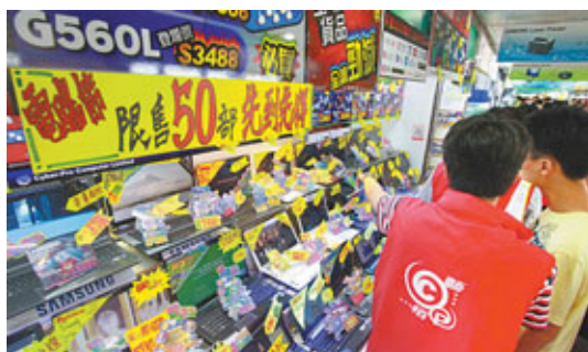
■「腦場夏日電腦節2011」入場人次較去年同期下跌近12%。