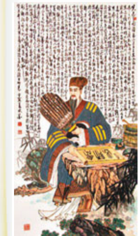
西元227年，諸葛亮率蜀軍伐魏，臨行前作《出師表》上書劉禪，懇切勸諫。

提起「90後」，社會總把他們標籤成「叛逆」、「不務正業」、「自視過高」，不過最近重慶一名16歲少男，卻在初中畢業之際提早為將來打算，趁暑假找兼職，更模仿《出師表》寫成自薦信《出職表》上載網絡，希望找到一份派傳單之類的基層工作，好體驗生存之苦。目前，已有三位市民受其打動，願意提供職位。