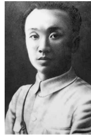
熊雄在主持黃埔軍校政治部工作期間，先後邀請了毛澤東、劉少奇、張太雷等到黃埔軍校作報告。