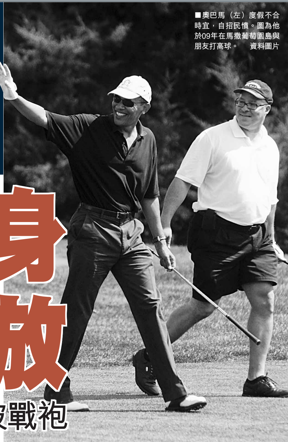
■奧巴馬(左)度假不合時宜，自招民憤。圖為他於09年在馬撒葡萄園島與朋友打高球。