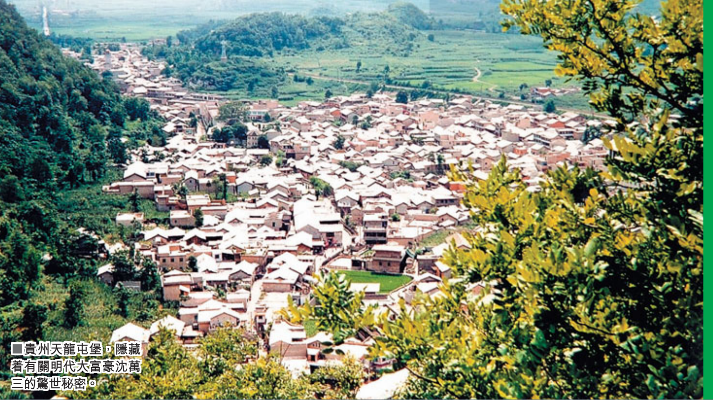
貴州天龍屯堡，隱藏着有關明代大富商沈萬三的驚世秘密。

為了保護家族血脈，沈氏隱姓埋名，但為了表示不忘祖。沈家定下了一些祖訓：如始終居住在一個屯堡裡面；供奉財神即「沈萬三」；以藏著密碼的族譜排序；世代經商等等。為了保護其餘的家族不受牽連，沈家不與另三家通婚；至於四大家族中第四個姓——張，有可能是張士誠的后代，因為歷史記載，沈萬三和張士誠過從甚密，並一直庇護着張族後人。也許沈家祖先的種種顧慮是對的，100年之中（恰好為5代左右），在江南的沈氏前後遭到數次抄家滅門，沈氏一門逐漸式微。而延續在貴州的這支，卻依然十分完整地保存着。甚至到今天，他們的衣着、言談和舉止都帶着600多年前的習慣。