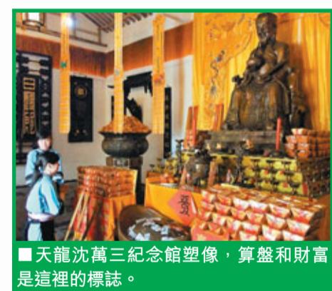
天龍沈萬三紀念館塑像，算盤和財富是這裡的標誌。

根據這些調查結果，扎西劉推測了這樣的可能性。出於保護自己子孫考慮，沈萬三將後代表挾在沐英的大軍中南下滇黔一帶，在沐英派出的陳、鄭等軍官的照顧下，沈萬三的后人及其龐大家族隱姓埋名在屯堡。（這個沈萬三的后裔可能是次子沈茂，因為長子沈旺及其後人先後遭到了朝廷的算計，而唯獨歷史對沈茂沒有任何記載。）