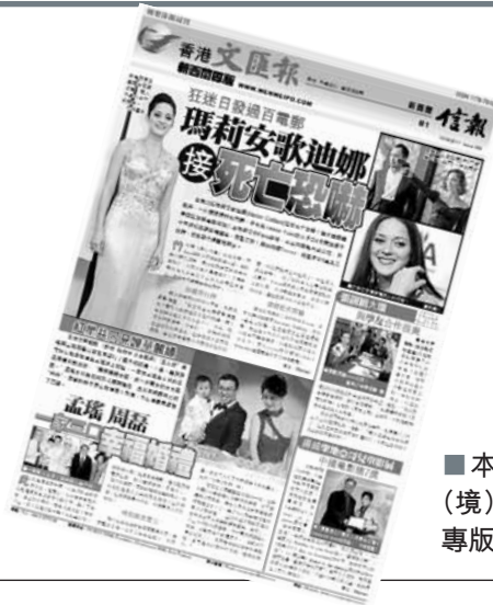
■本報第21個海(境)外版新西蘭專版昨日出版。

近年，香港《文匯報》積極開拓對外合作，目前已開辦21個海(境)外版，每天除在香港、內地出版發行外，還通過網絡傳輸，同步印刷發行至台灣、日韓、東南亞、歐美、加拿大、新西蘭等地區和國家，每日僅在台灣與海外發行量已超過百萬份。