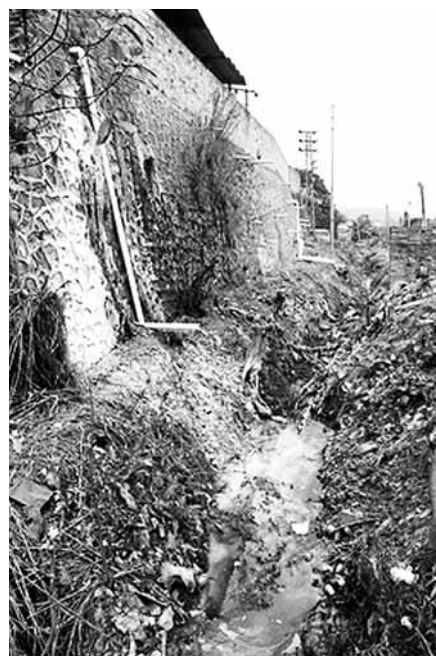
■電鍍業是珠三角嚴重的金屬污染源。圖為東莞一家電鍍廠排出的黃綠及乳白污染物。

部分地區電鍍行業是當地支柱產業，一旦搬遷，經濟短期內可能受損，因此當地政府積極性不強。此外，環保部門對進入園區的電鍍廠的工藝水平要求高，同時需要統一管理，運營費也要提高。也有專家指，電鍍污染主要集中在製造業發達的沿海地區，涉及的面並不是整個內地，因此對治理電鍍污染並沒有強硬規定，導致部分企業在觀望。