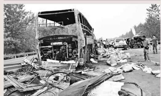
■7月22日在京珠高速信陽明港段發生的巴士火災，造成41人死亡，6人燒傷慘劇。圖為肇事現場。

香港文匯報訊 據中通社10日報道，官方消息證實，京珠高速客車事故中被燒至炭化、無法辨別的41具屍體，已全部經DNA比對確認，賠償已全部到位，遺體也已全部火化。