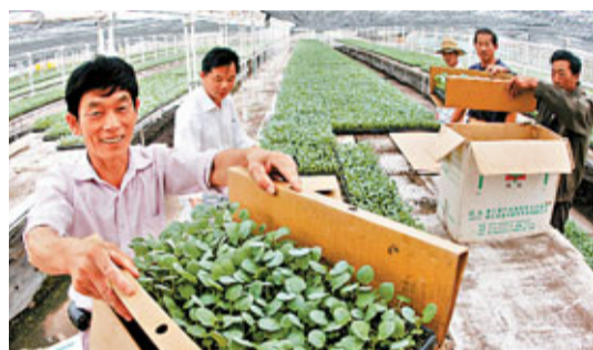
慈溪現代農業工廠式育苗