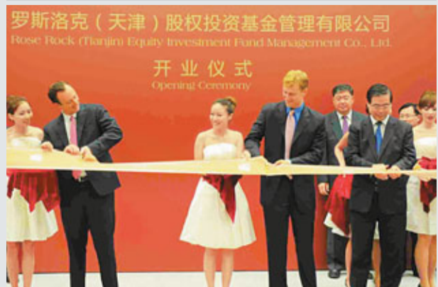
天津市委常委、副市長崔津渡(前排右二)與斯蒂文·洛克菲勒三世(前排右三)共同為開業儀式剪綵。

香港文匯報訊 (記者 鄧哲 天津報導) 羅斯洛克(天津)股權投資基金管理公司8日在京舉行開業儀式，該公司由美國洛克菲勒家族旗下的全資公司羅斯洛克資本有限公司與天津新金融投資有限公司合資成立，標誌着洛克菲勒家族正式入駐天津濱海新區。