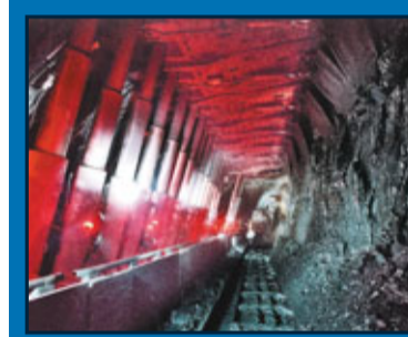
■整合兼併後的年產億噸級煤企，全部實現機械化、信息化開採。