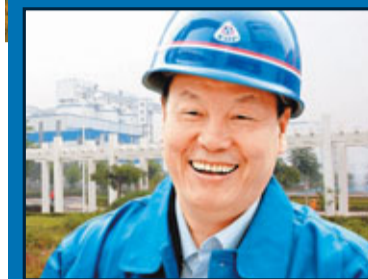
■山西省煤炭廳廳長王守禎。