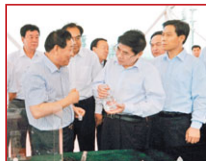
■省委書記袁純清2010年6月8日在潞安集團視察煤基合成油項目。