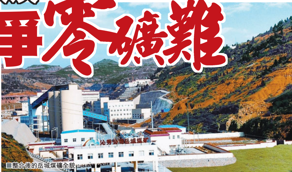
■整合後的岳城煤礦全貌。

據悉，煤礦兼併重組期間，政府與企業、國企與民企間的利益衝突，盤根錯節，爭論不休。經過近一年談判，基本照顧到各方利益，為資源整合收官掃平了障礙。今年5月25日，在山西省煤炭工業工作會議上，王守禎鄭重宣佈：全省整合礦井全部關閉，全面進入現代化礦井建設階段。