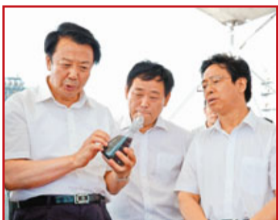
■王君省長2009年6月25日在潞安集團視察煤基合成油生產。

山西號稱「烏金天府」，全省面積15.7萬平方公里，含煤面積達四成以上，1996年探明儲量2,662億噸，約佔全國的三成。上世紀九十年代，國家推行「強化東部，戰略西移」決策，確立以山西為中心的全國能源基地戰略地位，從此，山西承擔起「西煤東運，北煤南調」的歷史重任。資料顯示，新中國誕生以來，山西累計生產原煤120億噸，輸往全國26個省、市、自治區90億噸，佔全國外調份額的八成，煤炭出口1,700萬噸，佔全國出口份額的七成。