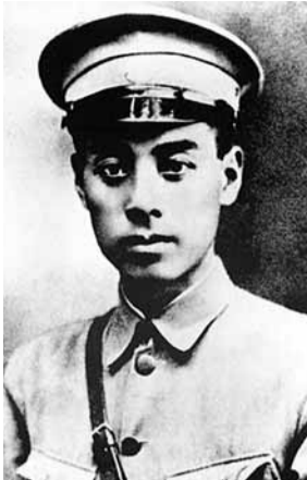
黃埔軍校期間的周恩來。