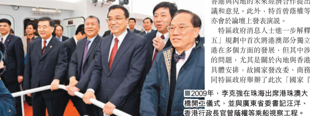
2009年，李克強在珠海出席港珠澳大橋開工儀式，並與廣東省委書記汪洋、香港行政長官曾蔭權等乘船視察工程。

中央一直非常關心香港的經濟民生，據悉，李克強於訪港期間，會抽空參觀香港金融管理局、香港交易所等與金融行業相關的機構，了解香港金融運作情況，而為了解香港民生問題，他亦計劃參觀職業訓練局的訓練中心，了解本港職業培訓工作，又估計會和其他訪港的國家領導人一樣，走進平常市民家，到香港基層家庭訪問，了解香港基層市民的生活情況。