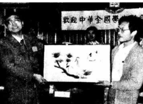
李克強1984年訪港時接受香港學聯贈送紀念品。