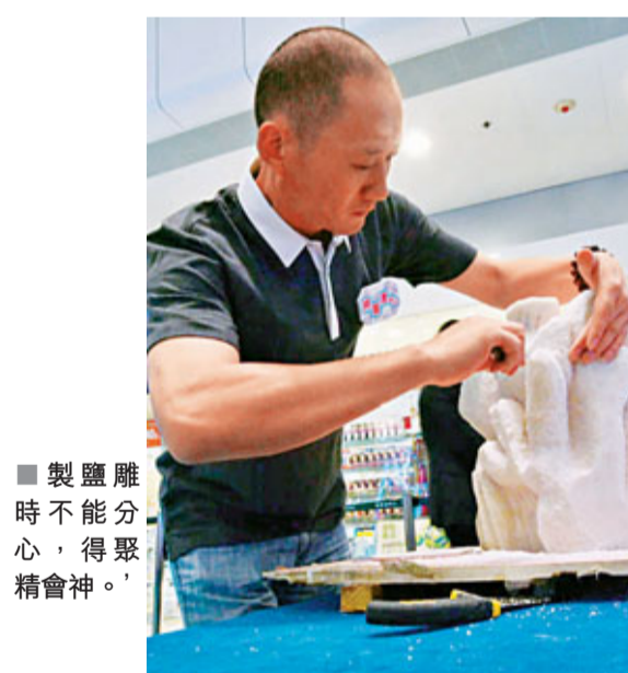
製鹽雕時不能分心，得聚精會神。