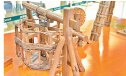
高逾2米的鹽井、採鹽車及汲鹽筒互動模型。

中國鹽業歷史於5,000年前由夙沙氏煮海為鹽揭開了序幕。自春秋戰國開始，鹽的專賣都受到每朝代的政府重點管制，為主要財政來源，有「天下稅賦，鹽利居半」的說法。隨後的湖鹽和井鹽生產相繼出現，鹽被廣泛應用於人的生活上，影響力驚人，更引發多次「鹽商爭利」、「鹽商造反」，甚至因鹽爭利造成兩國戰爭。時至今日，鹽已融入人類生活每一個範疇，包括煮食、美容、工業化工，甚至藝術創作上。如果大家想深入了解構鹽之功效，鹽雕館的另一邊就是鹽學館，為大家認識鹽的重要性、簡述古今有關鹽的種類、開採、製作過程、交易及戰爭的簡歷，還展示了由四川自貢市中國鹽業歷史博物館借出多件鹽業開採工具及相關展品，包括高逾2米的鹽井、採鹽車及汲鹽筒互動模型。