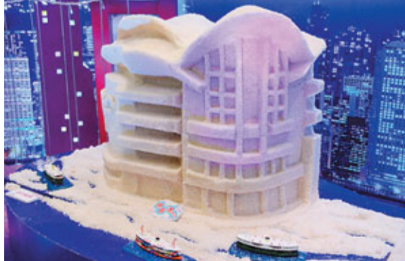
用鹽雕出灣仔會展中心。