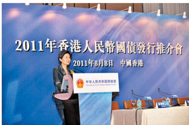
2011年香港人民幣國債發行推介會 2011年8月8日 中國香港

另外，人行昨日公布銀行間外匯市場美元等交易貨幣對人民幣匯率的中間價為：1美元兌人民幣6.4305元，較上周五(5日)回升146點子，創匯改以來新高。