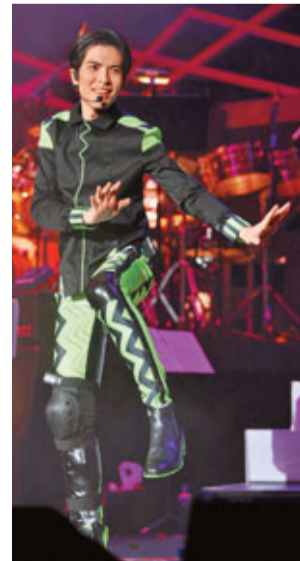
蕭敬騰在紅館演唱會上表演。

香港文匯報訊(記者 梁靜儀)台灣歌手蕭敬騰(見圖)一連兩場於紅館舉行的巡迴演唱會，尾場已於前晚圓滿結束，當晚全場爆滿，方大同、張智霖及太太袁詠儀也有捧場，由於歌迷反應熱烈，最後「安歌」兩次歌迷才滿足地離去。