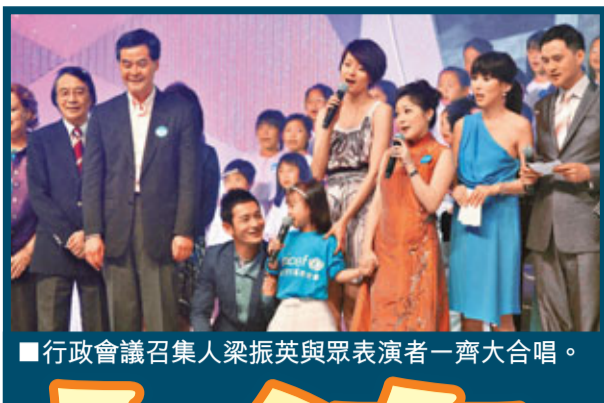
行政會議召集人梁振英與眾表演者一齊大合唱。

香港文匯報訊(實習記者 陳麗芸)黎明(Leon)、楊采妮、梁詠琪(GiGi)、楊千樺、孫耀威、黃曉明和薛凱琪等昨晚出席聯合國兒童基金會香港委員會慈善音樂會，眾明星表演不遺餘力，呼籲大眾踴躍捐款。黎明扁桃體發炎仍堅持演唱，楊采妮只露面不唱歌。近日笑容滿面的梁詠琪，被記者追問是否有新戀情時，她只露出甜笑，似乎默認有新戀情。