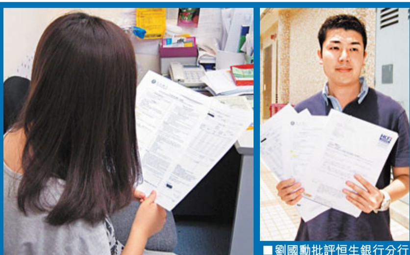
劉小姐手持購買的保單。

劉小姐於事後翻看職員提供的相關資料文件中，發現當中附有一份名為「恒生銀行港元儲蓄戶口服務費」的文件，才知道自己可獲豁免最低存款規限，卻被誤導購買了無需要的保險產品。她不滿兩名職員「由頭至尾沒有提過我不足21歲，本身