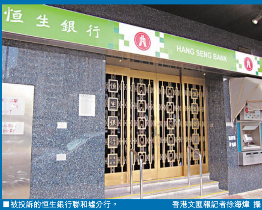
被投訴的恒生銀行聯和墟分行。