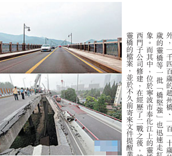
■上圖是74歲的錢塘江大橋，下圖是14歲的錢江三橋。

十月施政報告之前，曾蔭權積極分別與港區區代表、政協委員和多個政黨社團等會晤，聽取訴求和意見。據我所知，反應亦頗積極。事前先作準備做好功課，以主人翁態度向行政長官提意見。曾蔭權頗認真聆聽並作筆記，也作概括回應。至於是否「聽得入耳」，有否接納，又或者他早有共識，胸有成竹呢？還有不足兩個月施政報告出爐時，便可知曉。屆時是否能安撫社會市民的怨氣，又能否處理好市民訴求，平衡社會矛盾呢？相信只能等著瞧而已。事實上，來自各方不同利益，不同需要訴求，任何政策措施都不可能全部滿足，不可能皆大歡喜。重建華年提出「八萬五」建屋計劃結果推林樓宇和百業。而今樓宇漲升，復建居屋之聲又起。試問居屋再建又是否真箇能買到平樓上到車呢？其實，現時香港市場已有變，已是面向國際市場了。