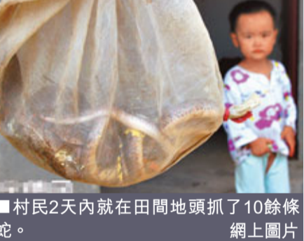
村民2天內就在田間地頭抓了10餘條蛇。

福建福安一名男子比較迷信，從福州花鳥市場買來近千條蛇帶回福安松羅鄉放生，導致松羅鄉三個村莊鬧起蛇災，百姓惶恐不敢上山。