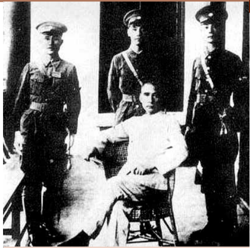
孫中山在黃埔軍校開學典禮後，同蔣中正(中上)、何應欽(左)、王柏齡(右)合影。

國共合作，從一開始就是充滿矛盾的，共產黨內有不同看法，國民黨內也有不同看法。不過國共兩黨的主要領導人還是看好彼此的合作。