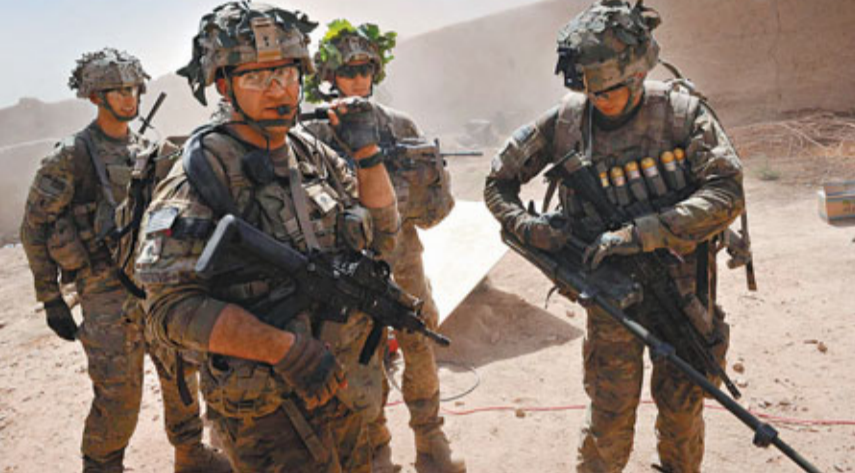
■美軍一支戰鬥部隊在阿富汗西部一個村莊巡邏。