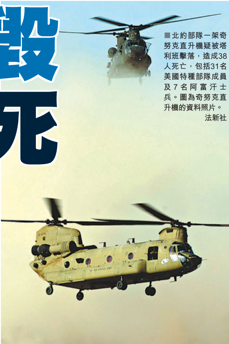
■北約部隊一架奇努克直升機疑被塔利班擊落，造成38人死亡，包括31名美國特種部隊成員及7名阿富汗士兵。圖為奇努克直升機的資料照片。