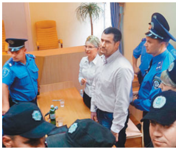
■5日，在烏克蘭首都基輔，烏克蘭前總理季莫申科在庭審結束後被多名警察押送離開。