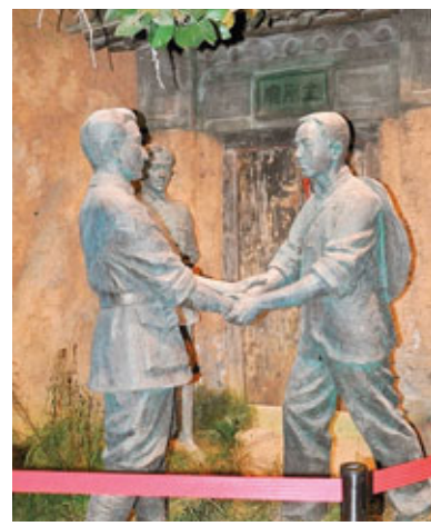
陝甘邊革命根據地領導人劉志丹、謝子長、習仲勳塑像。

1935年，中央紅軍經歷千辛，抵達陝北。當時，很多地方的牆壁上都張貼着《陝甘邊區蘇維埃政府佈告》，下面署名「主席習仲勳」，這些都給毛澤東主席留下了深刻的印象，也讓他牢記住了習仲勳。而當毛澤東在瓦窯堡看到習仲勳時，他怎麼也沒想到，大名鼎鼎的「習主席」，竟然如此的年輕，以至於他驚訝的連呼：「這麼年輕！」。後來，毛澤東多次評價習仲勳「年輕有為」、「能負重任」，是「從群眾中走出來的群眾領袖」。