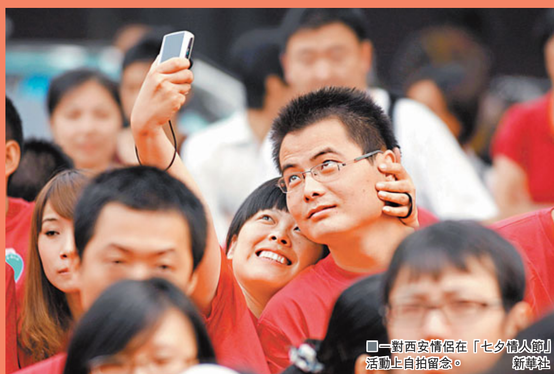
一對西安情侶在「七夕情人節」活動上自拍留念。

有人擔心，七夕這個中國傳統節日變成了翻版西方「情人節」。更有網友指，七夕牛郎織女鵲橋相會表達的是一種夫妻間白頭偕老的忠貞，和情人節要表達的根本就是兩種情感；而如今七夕亦成了商家促銷的一種手段。