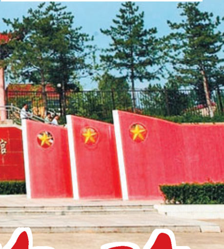
陝甘邊照金革命根據地紀念館。

在這幾個寨子中，除指揮中心外，三號寨作為紅軍的兵工廠，是最值得一提的。當年，這個兵工廠工人最多時有60多人，他們為陝甘邊游擊隊、紅26軍供應了大量的槍支彈藥。同時，他們在這裡還發明了中國軍隊史上著名的「麻辮手榴彈」。這種手榴彈，利用麻繩編成辮子樣，然後再拴在手榴彈上，落地就炸，具有很大的殺傷力，為當年根據地的鞏固做出了較大的貢獻。如今，這些寨子都將成為紅色旅遊特色景點。