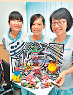
■中學組大獎——伊利沙伯中學學生會湯國華中學的參賽同學及其作品「千回」。