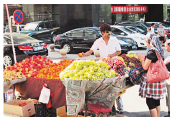
■水果飄香，生意如常。

香港文匯報訊(記者 賀臻、通訊員 隋雲雁 烏魯木齊報導) 8月是新疆最好的季節，雖然7月底發生在喀什市的兩起暴力恐怖案件，但對當地民眾生活沒有造成巨大的改變，喀什民眾對未來發展依然抱有信心。