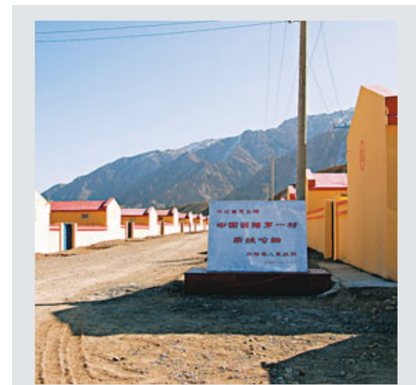
■新疆烏恰縣吉根鄉斯姆哈納村。

新疆伊斯蘭教協會副會長、喀什市艾提尕爾清真寺哈提甫居馬·塔伊爾對喀什未來的發展充滿信心，同時對喀什市發生的連環襲擊事件表示強烈譴責，他告訴記者，聽到這兩起暴力恐怖案件的發生，感到非常氣憤。一小撮暴力恐怖犯罪分子和境外「三股勢力」有著千絲萬縷的聯繫，他們替境外的主子賣命，妄圖把新疆從祖國母親的懷抱裡分裂出去，他們的企圖我們絕不答應。他們殺害無辜羣眾，喪心病狂，犯下滔天罪行，但他們的目的絕不可能達到。 此外，8月5日是新疆穆斯林民眾今年「封齋」後的首個、也是新疆喀什接連發生暴力恐怖案件後的第一個「主麻日」。近萬名穆斯林民眾當天下午在位於喀什市中心的艾提尕爾清真寺內做禮拜。