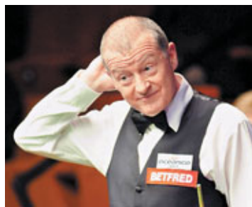
香港文匯報記者 蔡明亮

6屆世界冠軍戴維斯(見圖)周三在上海桌球大師賽外圍賽第3圈中，以總局數1:5不敵名不見經傳的泰國球手，與另一桌球名將韋德無緣正賽。韋德在第3圈以直落5局0:5負邦特出局。