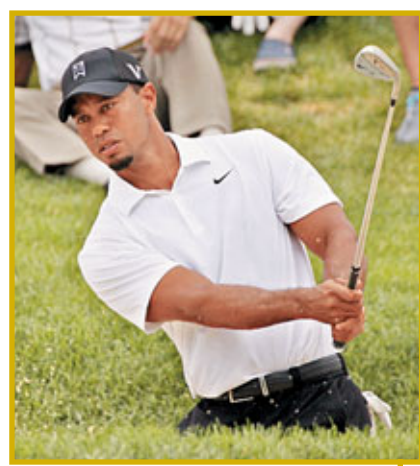
活士養傷近3個月後終告復出。