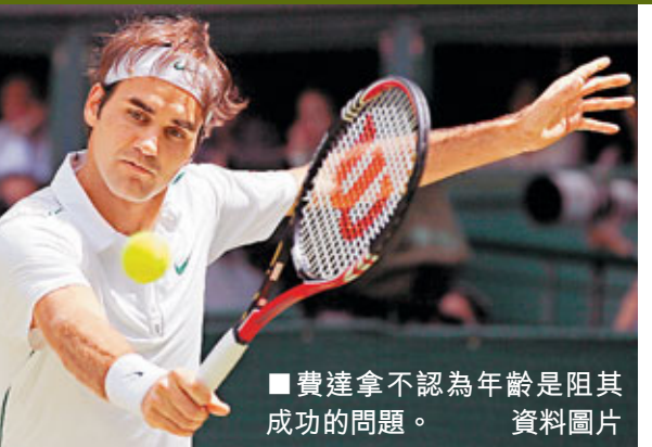
費達拿不認為年齡是阻其成功的問題。