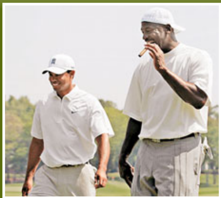
米高佐敦(右)被指與巴克利帶壞活士。