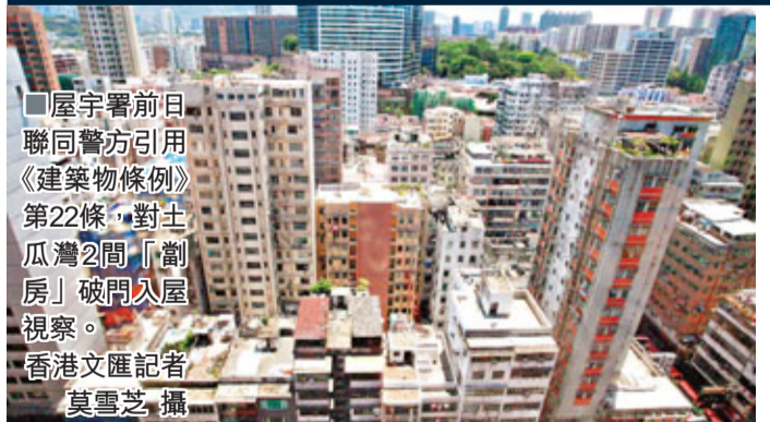
屋宇署前日聯同警方引用《建築物條例》第22條，對土瓜灣2間「劊房」破門入屋視察。

字，假如有需要，可以於警務人員在場下破門入屋，查看建築物是否構成危險。屋宇署希望在下一個立法年度修例，日後只需持法庭簽發的手令即可入屋。