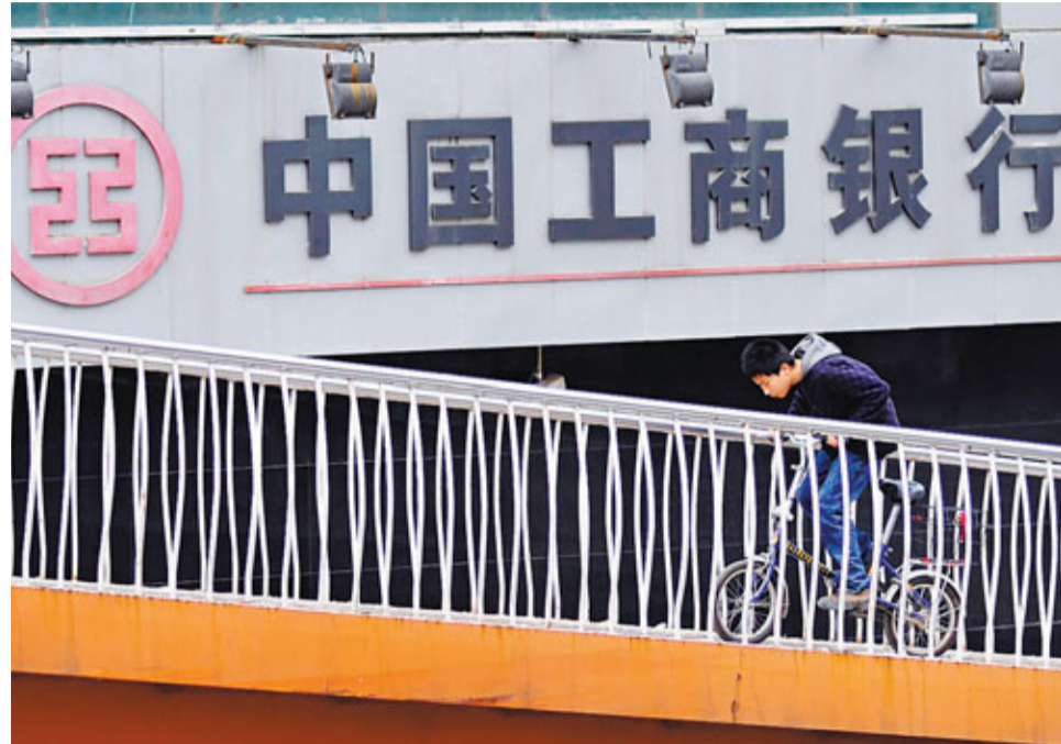
■ 工行股東是次配售股份的價格較昨日收市價折讓1%至3%。

據銷售文件顯示,該工行股東按每股5.81至5.93港元配售,較昨日收市價5.99港元有1%至3%折讓,配售約6.38億H股,是次配售套現4.76億至4.86億美元。高盛負責安排是次配售安排。