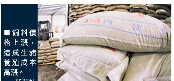
■飼料價格上漲，造成生豬養殖成本高漲。

中國農業大學動物科技學院教授王愛國分析稱，成本推動是肉價上漲的最主要因素。今年上半年，玉米平均價格上漲一成，比近5年同期平均水平上漲三成以上。與此同時，生豬飼養員工資同比漲幅也在二成以上。中國農科院農業經濟與發展研究所副所長王濟民和王愛國的觀點一致。王濟民認為，飼料和勞動力成本是生豬養殖成本的主要組成部分，二者的上漲在一定程度上