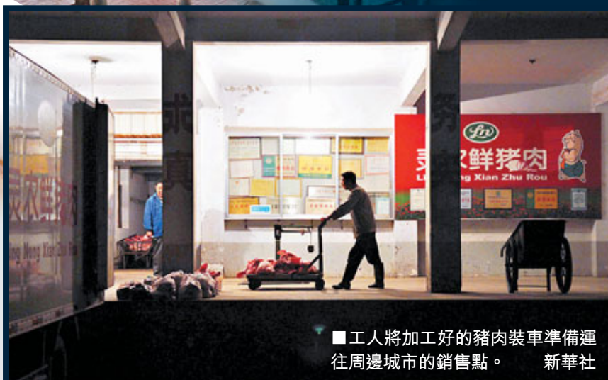
■工人將加工好的豬肉裝車準備運往周邊城市的銷售點。