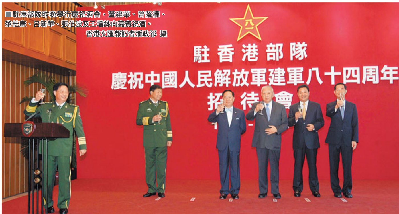
駐港部隊昨晚舉行慶祝酒會，董建華、曾蔭權、黎桂康、呂新華、張仕波及王增鈺向嘉賓祝酒。

香港文匯報訊(記者 沈清麗) 中國人民解放軍駐香港部隊昨晚在中環駐軍總部舉行酒會，慶祝中國人民解放軍建軍84周年。全國政協副主席董建華，特區行政長官曾蔭權，中聯辦副主任黎桂康，外交部駐港特派員呂新華，駐港部隊司令員張仕波及政委王增鈺共同主禮。特區政府官員、中央駐港機構主要負責人、港區全國人大代表和政協委員，及社會各界賢達逾350人聚首同慶，氣氛熱烈。