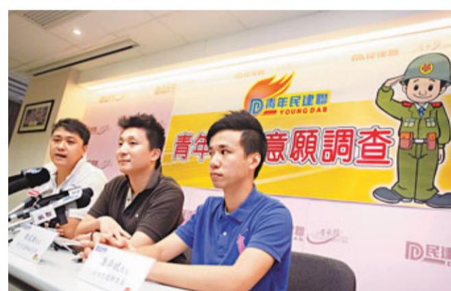
青年民建聯公布調查結果，顯示67%受訪者認為香港市民應該有權利自願參與加入解放軍。

香港文匯報訊(記者 鄭治祖) 昨日是解放軍建軍84周年暨解放軍部隊駐港14周年，青年民建聯一項調查結果顯示，67%受訪者認為，香港已回歸祖國十多年，香港市民應該有權利自願參與加入解放軍。若解放軍提供自願軍或非正式軍人編隊，供港人參加，有46%受訪者表示有興趣參加。結果又顯示，有接近一半青年人對駐港解放軍印象良好。青年民建聯建議，解放軍應容許香港市民參軍，讓港人負起保家衛國的責任。