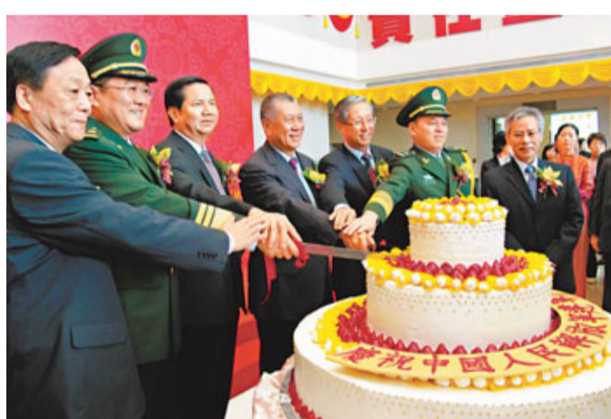
駐澳門部隊舉辦慶祝建軍84周年酒會，主禮嘉賓進行切蛋糕儀式。