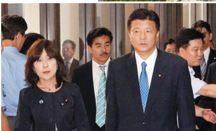
■左起，稻田朋美、佐藤正久、新藤義孝在首爾機場被警方帶往羈留室，其後被遣返東京。

韓國民間團體逾200名示威者昨在金浦機場附近抗議，他們高舉獨島照片及印有「禁止日本人入境」的橫額，更有男子在機場入境大堂大喊「殺掉日本人」。該國網民對日本議員被拒入境議論紛紛，不少人痛斥日本野心勃勃，甚至稱韓日將來必有一戰。