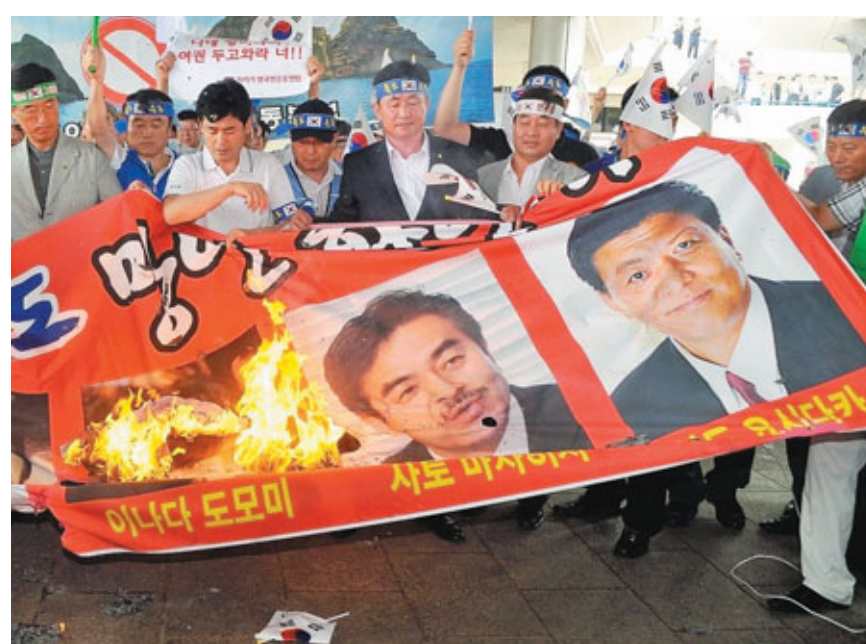
■韓國示威者在金浦機場附近燒3名日本議員的照片抗議到訪。