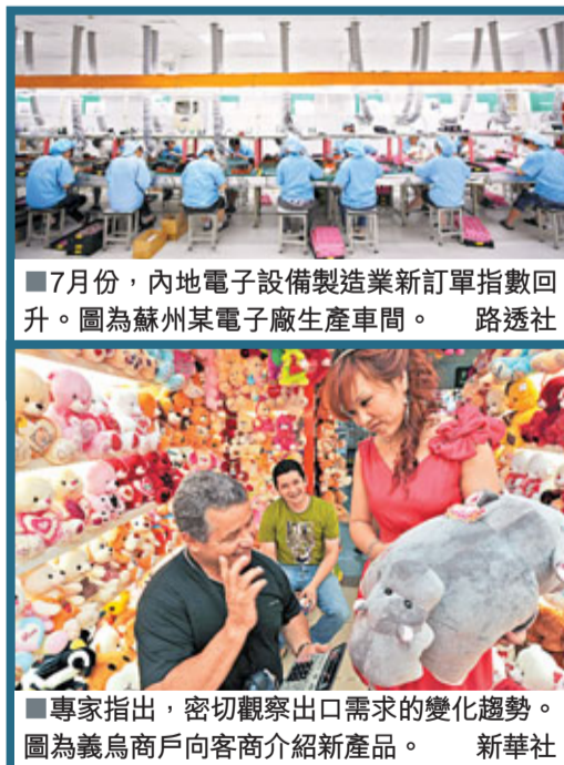
■7月份,內地電子設備製造業新訂單指數回升。圖為蘇州某電子廠生產車間。

出於樣本選取的不同,匯豐PMI調查的400多家中國製造業企業,有70%屬中小企業。因而更能反映當前中小企業經營所面臨的困難。屈宏斌指出,低於50的數值顯示內地中小企業受通脹、銀根收緊政策的影響較大。雖就整體數值來看,大型企業與中小企業的經營狀況均在回落,但中小企業明顯處於更艱難的境地。