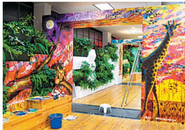
■ Gary的「非洲大草原」

時間：即日起至12月31日 地點：中環街市綠洲藝廊 (中環域多利皇后街) 查詢：9644 5168