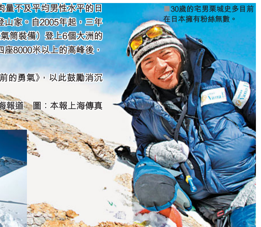
30歲的宅男栗城史多目前在日本擁有粉絲無數。

登山過程中獨自面臨生死考驗，的確是一件寂寞又可怕的事情。栗城史多的真實在於，他並沒有因為要鼓勵大家追求夢想，而對這些痛苦諱莫如深。他坦言，離開帳篷的那一刻，最為恐懼。「每次離開帳篷的時候我都在想，究竟我能否再活回來是很大的疑問，想到這些，我就會感到非常恐懼，同時巨大的痛苦便迎面襲來。」而栗城史多的高明則在於，他不但是登山家，更是「哲學家」。他提出，既不要對抗這些痛苦，也不要逃避它，而是要與之為友，「對待痛苦的首要因素是，不能對抗它，只要你去對抗這個痛苦，痛苦就會越來越膨脹，越來越大；而痛苦的另一個特點是，只