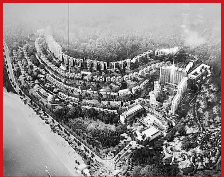
■總投資約36億元的撫仙湖國際養生園項目中，環保設施投資即高達2億元。

在地方政府、民間等各方的齊心努力下，撫仙湖經近年來持之以恆的保護與治理，開始「變清」：09年撫仙湖水質主要監測標準與02年相比，透明度由4.47米上升到5.43米，撫仙湖成為中國保護最好的淡水湖。