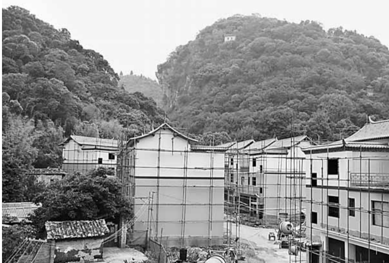
■為保護撫仙湖，明星村村民響應政府沿湖100米範圍內禁建建築物的舉措，主動搬家至百米外。圖為100米範圍外新建的住宅區。

李文志表示，國際養生園將「綠化項目」列為首要工程先期啟動，將生態環保作為首要工作予以重視等一系列工作證明，其發展規劃符合「特區」的高標準要求，從而得以在眾多競爭中成功落戶玉溪。