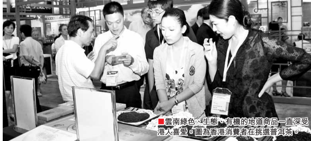
■雲南綠色、生態、有機的地道商品一直深受港人喜愛。圖為香港消費者在挑選普洱茶。