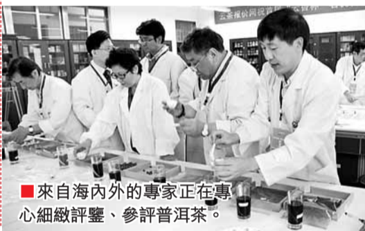
■來自海內外的專家正在專心細細評鑒、參評普洱茶。

從普洱茶、野生菌到火腿、螺旋藻，雲南綠色、生態、有機的地道商品一直深受港人喜愛。為讓香港消費者能放心地購買到百分百優質雲品，雲南省商務廳主辦、雲南品牌企業促進會承辦了此次活動，許多商品甚至是